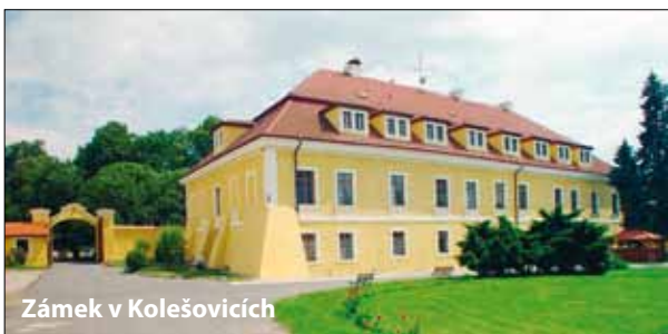
Zámek v Kolečovicích