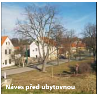
Náves před ubytovnou