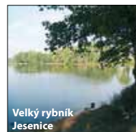
Velký rybník Jesenice