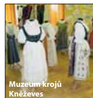
Muzeum krojů Kněževs